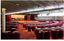
DECK6 ギャラクシーラウンジ