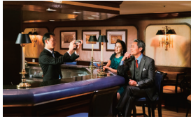
DECK6 マリナーズクラブ